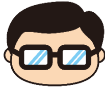
岩沼市マスコットキャラクター 岩沼係長