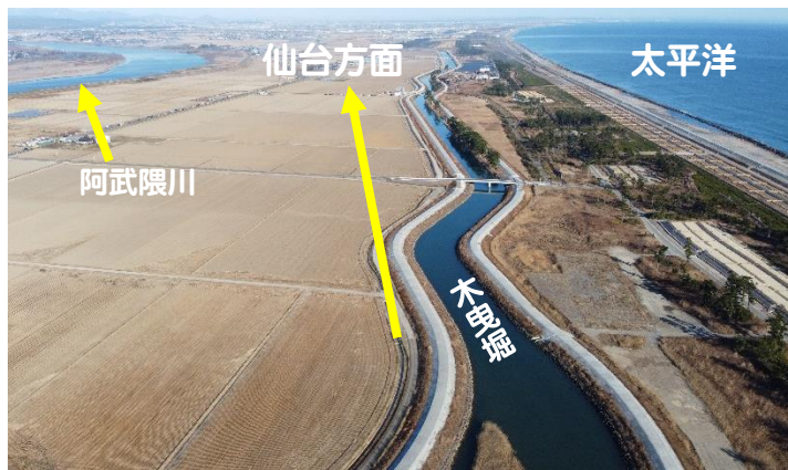
上空から見た木曳堀