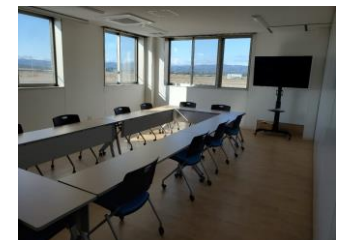
【事務所棟2階会議室】