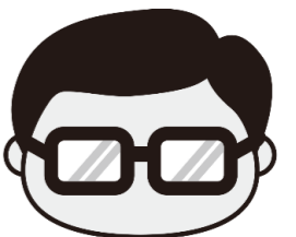
マスコットキャラクター 岩沼係長