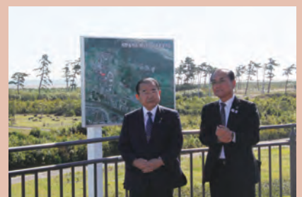
▲千年希望の丘を視察された田中大臣(左)