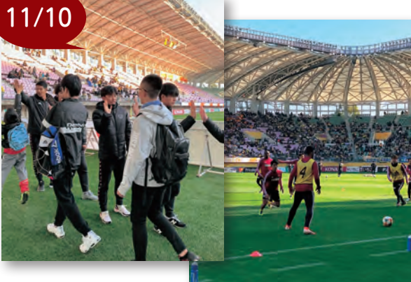
▲間近で練習を見たり、選手とハイタッチしました