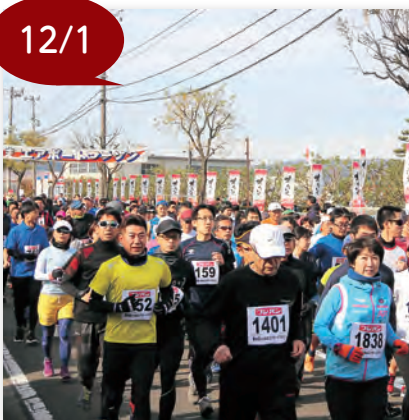
▲ゴールを目指してスタート