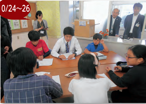
▲各学校の代表として、しっかり学習しました