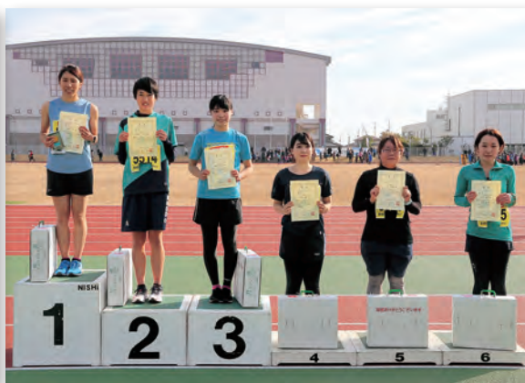
▲入賞者全員に副賞として長岡のリンゴも贈呈されました

声援受け市内を駆ける 〈いわぬまエアポルトマラソン〉 陸上競技場を発着点として、「第28回いわぬまエアポルトマラソン」が開催され、2千人を超えるランナーが市内を駆け抜けました。市民の入賞者を下記のとおり紹介します。