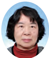
森 すみえ たけくま第一東