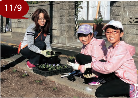
▲参加した皆さんは沿道にピオーラを植えました