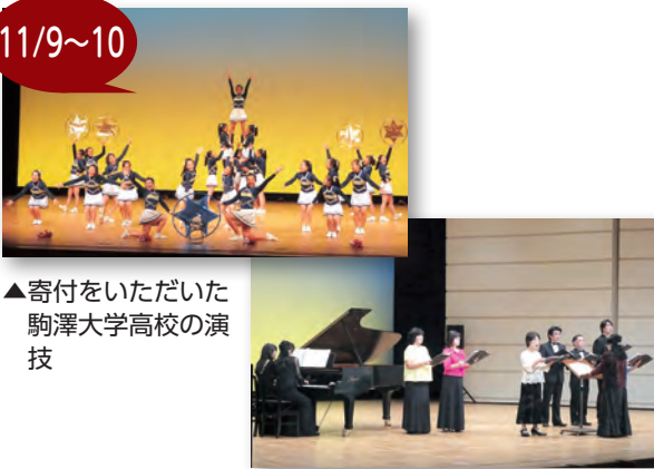
▲寄付をいただいた駒澤大学高校の演技