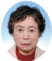
木我 礼子 中央四丁目第三