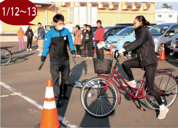
▲外国人従業員の皆さんが教室に参加されました

（株）にしき食品で、「外国人向け自転車教室」が行われ、フィリピン出身の従業員39人が参加しました。この教室は実技と講義の2種類で構成され、計2時間の学習が行われました。 操作技術の習得では、サイクルベースあさひの方が自転車の仕組みなどを紹介し、講義では、岩沼市交通安全指導員が紙芝居を使って交通规则を説明しました。 参加者からは日本の交通规则で分からないことなどの質問が活発に出され、交通规则を意欲的に学ぶ姿勢が見られました。