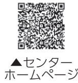
▲センターホームページ

申込方法／申込用紙に必要事項を記入し、郵送、ファクスまたはPDFデータ化したファイルを添付し、メール (yousei@minisupport-miyagi.org) で申し込み