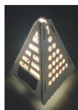
▲工作するソーラーハウス

※当日撮影した写真は、広報紙やホームページなどで使います。 ※申込多数の場合は抽選。抽選結果は、申込時のメールアドレスにお知らせ。