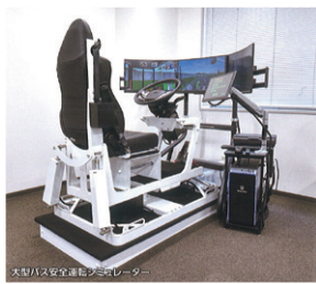
▲バス運転シミュレーター