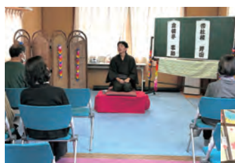
◀出前落語では、会場が笑いに包まれました