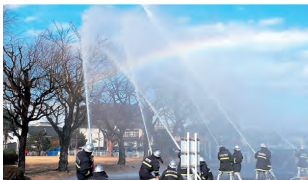
▲無火災を願い一斉に放水を行う様子

消防団員による実地放水では、市役所の芝生広場に向かって水しぶきが舞い上がり、参加者は無災害・無火災を願いました。