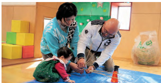
▲地域の方に教わり、伝統文化を体験しました

参加した保護者は「なかなかしめ縄を作る機会が無いので、今回作ることができて良かった。自宅に飾ろうと思う」と話しました。