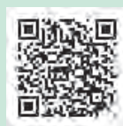
▲確定申告書等作成コーナー