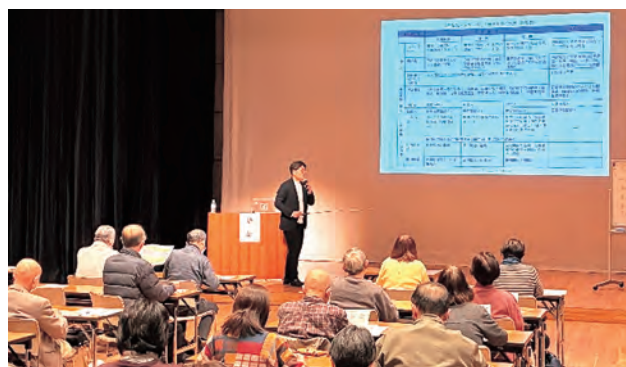
▲真剣に話に聞き入る参加者

参加者は「とてもよく理解できた。制度について知る機会をもっと増やして欲しい」と話しました。