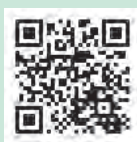
▲個人住民税申告に係る特設ページ