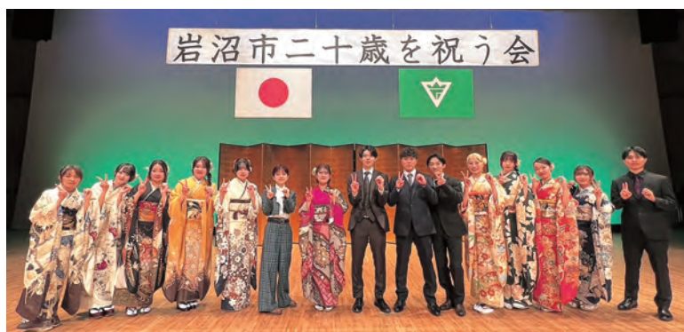
▲二十歳を祝う会実行委員会の皆さん

1月11日、市民会館で「二十歳を祝う会」が行われ、令和7年度に二十歳になる439人が晴れやかな門出を迎えました。式典では、祝辞の披露や記念品の贈呈が行われ、参加者は友人や家族と共に新たな一歩を祝いました。 また、二十歳を祝う会実行委員会による「思い出スライドショー」や「お楽しみ抽選会」が行われ、会場は笑顔と歓声に包まれ、和やかな雰囲気の中で心に残るひとときとなりました。