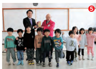
▲岩沼保育園の年長児が 市役所を訪問しました (12月26日)