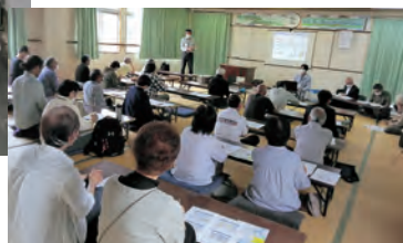
防災講演会の様子▶