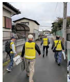
◀防災支援隊のベストを着用しての訪問活動