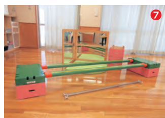
▲巧技台一式と つかまり立ちミラー

寄付・寄贈いただきました 関包スチール(株)、(株)銚建仏光堂、(株)アステムの各社から、企業版ふるさと納税を活用した寄付金をいただきました。いただいた寄付金は、ハナトピア岩沼リニューアル事業や中学生海外派遣事業などに活用されます。(1)~(3) 竹駒神社から歳末義援金を、岩沼保育園から園のクリスマス会で集めた献金をいただき、市を通じて岩沼市共同募金委員会に寄付しました。(4)~(5) 岩沼ロータリークラブから、巧技台一式とつかまり立ちミラーが寄贈されました。すぎのご学園での療育に活用されます。(6)~(7) ありがとうございました。