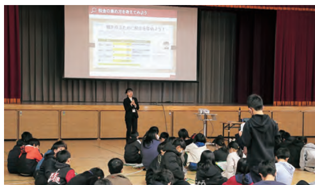
▲グループワークでまとめた意見を発表する児童

教室では、税金の種類や使われ方、集め方などの講話に続き「公共施設を作る際の税金の使い道」や「どうしたら税金を公平に集められるか」をテーマにグループワークを行い、税金の役割や大切さを学びました。