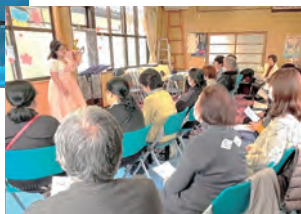
オペラコンサートの様子▶