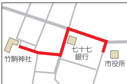
▲街頭行進に合わせて順次交通規制が行われます

※当日7時に各ポンプ置場のサイレンを鳴らします。火災・災害と間違えないように注意してください。