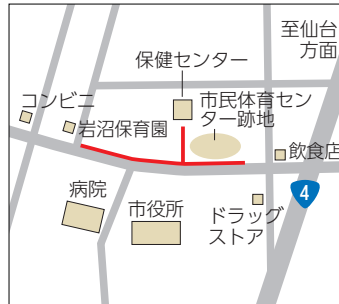
▲①二木大通線配水管布設工事

火災が発生した際、一刻も早く消火活動が行えるよう、自宅周辺に消火栓がある場合は、除雪のご協力をお願いします。