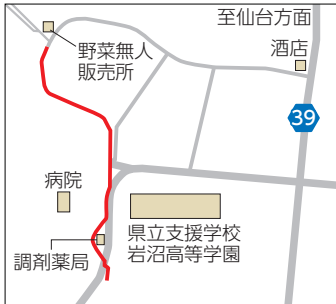
▲②松崎北長谷線外舗装復旧工事