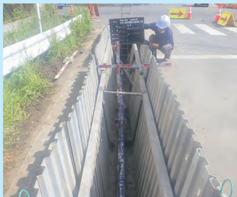
▲水道管更新工事の様子

市では、毎年市全域での洗管作業を夜間に実施しています。消火栓などから多量の水を流すことで管内のさびなどを取り除き、安心・安全な水道水の供給を維持しています。