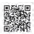
▲警察庁ホームページ