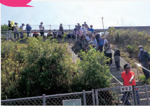
▲東部道路の避難階段に避難

東部地区では津波避難訓練 昨年5月の県による最大クラスの津波浸水想定公表後初となる津波避難訓練では、分散避難を基本としながら、阿武隈川の堤防、東部道路の避難階段、新たに津波避難先として指定した民間企業2施設などを目指しました。参加者は、それぞれの避難ルートや避難行動を確認しました。