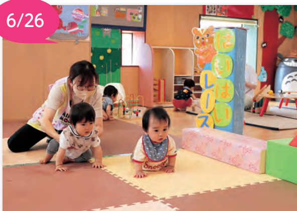
▲はいはいしてゴールを目指しました