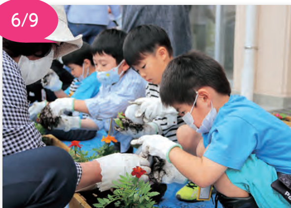
▲50本の花苗を植えました