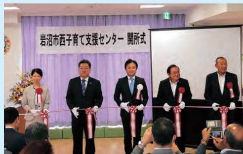
▲テープカットをする関係者の皆さん