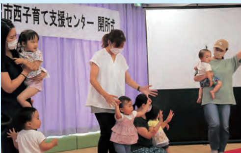
▲元気よく体操をする子どもたち