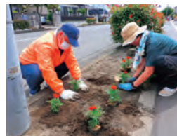
▲6月に行われた植栽活動 (駅前大通線)

申込・問 /花や木のまちを創る岩沼市民ネットワーク事務局 (環境課内 ☎23-0584)