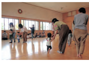
▲5月のぼかぼか〜の様子