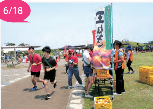
▲玉ネギを受け取るランナー