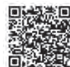
▲岩沼市地球温暖化対策実行計画