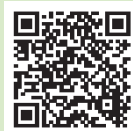
▲岩沼市のSNSの登録はこちらから