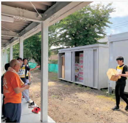
▲備蓄食料や資機材を点検