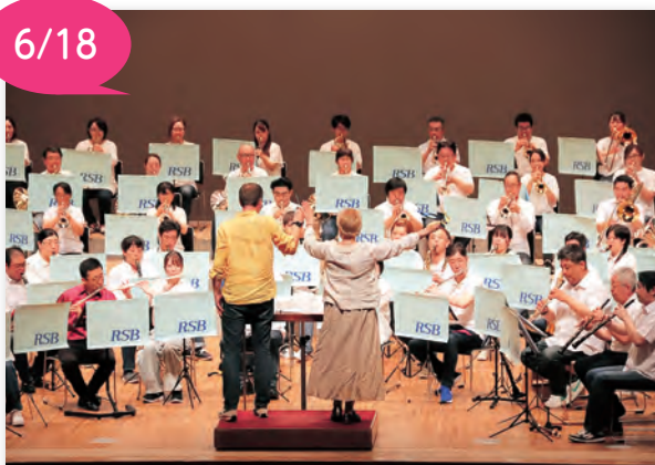
▲ウクライナ人親子が指揮をとりました