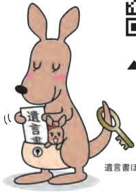
遺言書ほかんガルー