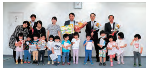
▲手作りのメッセージカードもいただきました

6月12日、6月の第2日曜日の「花の日」に合わせて、岩沼保育園の園児13人と職員の間が市役所を訪れました。子どもたちから花束のプレゼントを受け取った後、讚美歌「この花のように」が披露されました。