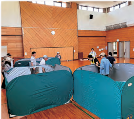
▲各避難所で開設手順などを確認

中央部・西部地区では自主防災訓練 中央部・西部地区では、自主防災訓練や避難所開設訓練が行われ、パーティションの設置、備蓄食料や資機材の点検、開設手順の確認など、実際の災害を想定した訓練を実施しました。