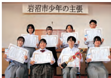
▲思いを込めて発表しました