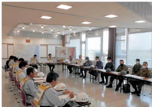
▲災害対策本部設置・運営訓練の様子

全国各地で地震や大雨による被害が相次いで発生しています。自然災害は、いつ・どこで起こるか分かりません。今回の訓練を踏まえ、地域防災力の一層の向上を図るとともに、防災関係機関との連携に力を注ぎ、市民の安全・安心の観点から防災対策に取り組んでいきます。