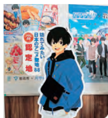
◀市内6カ所に設置されている等身大パネル

5月19日には、認定プレート贈呈式が行われ、会場には、アニメのグッズや手作りの横断幕を持ったファンも駆け付けました。また、聖地を訪れた証として自由に押すことが出来る御朱印スタンプも贈呈されました。