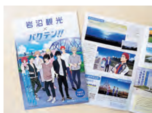
▲聖地巡礼マップと一体化したオリジナルパンフレット