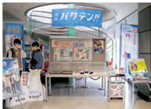
▲「バクテン!!」コーナー

アニメ「バクテン!!」は、岩沼市を舞台に男子新体操を通して成長する高校生たちの青春を描いた作品です。 作品には、皆さんがよく知る岩沼の風景が登場し、全国各地からファンが聖地巡礼に訪れています。 昨年12月、市は（一社）アニメツーリズム協会が主催する「訪れてみたい日本のアニメ聖地88」に選ばれました。