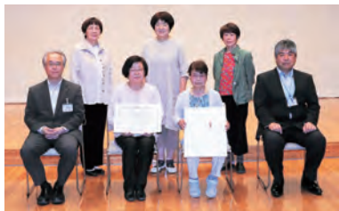
▲ほっぺの会の皆さん

5月31日、市民会館で県教育委員会協働教育推進功績者表彰が行われ、家庭教育支援チームほっぺの会に感謝状と記念品が贈呈されました。平成23年から市内の小学校や子育て支援センターで保護者向けの講座を実施するなど、市の協働教育に大きく貢献してきました。