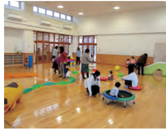
▲親子運動遊びデーの様子

日時/6月22日(木)、23日(金) 10時30分～11時30分 対象/乳幼児親子 ※申し込みは不要です。