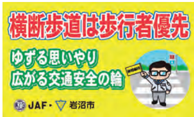
▲横断歩道マナーアップステッカー