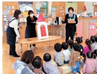
▲前回のおはなしたまてばこ

日時/6月6日(火) 10時30分～11時 内容/乳幼児親子向けの読み聞かせ 対象/乳幼児親子