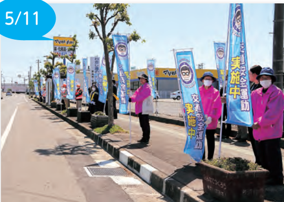
▲のぼり旗を掲げて安全運転を呼びかけました