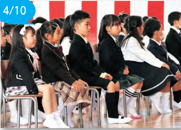
▲校長先生の話を真剣に聞く新入生