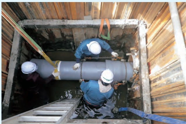
▲水道管工事の様子

漏水や赤水（水道管の内側に発生した赤さびが剥がれたものが混入した水）の原因となる老朽化した水道管を耐震性の高い管に入れ替える工事を行っています。工事中は交通規制や断水を伴うことがあります。ご理解とご協力をお願いします。