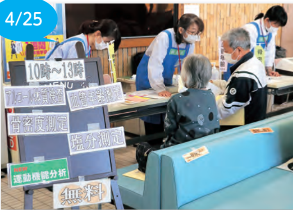
▲保健師、管理栄養士が測定結果の説明を行いました