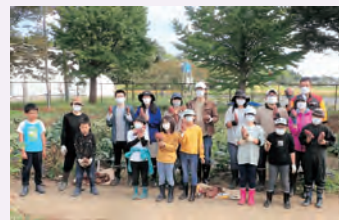
▲令和4年度参加の皆さん

小学生がいる家庭を対象に募集し、令和3年度は4家族、4年度は6家族の申し込みがあり、その年により種類は異なりますが、かぼちゃや枝豆、にんじん、ねぎ、とうもろこし、ブロッコリーなど、たくさんの野菜を育てました。大豊作の年もあれば、病気にかかり、うまく成長しないこともありました。しかし、野菜の作付けや収穫を通して、普段の食卓に並ぶお米や野菜の大切さを学べる機会になっています。