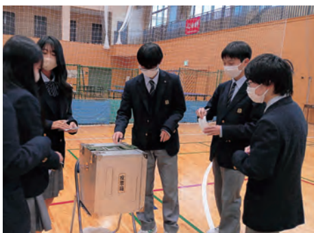
▲実際の選挙をイメージしながら行いました