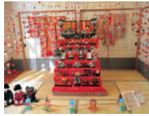
▲七段の雛飾りとつるし雛