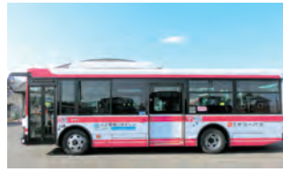
▲令和5年度から運行する車両

4月から市所有の車両とバス事業者所有の車両が混在して運行します。それに伴い、乗車方法については、現在は前乗り中降りですが、令和5年度は中乗り前降りとなり、運賃は後払いに変更となります。