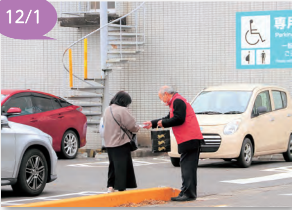
▲来庁者にパンフレットを配布しました

委員は、人権相談などを行っている民間の方です。近隣トラブルなど身近な問題や、新型コロナウイルスに関連した、不当な偏見に基づく差別の相談なども受け付けています。一人で悩まず、気軽に相談ください。啓発活動では、啓発グッズなどを配り、人権の大切さを伝えました。 (12、20ページに関連記事)