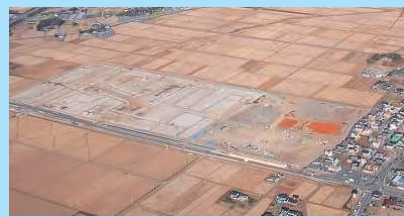
▲住民の意見が反映されて整備された ▼玉浦西地区