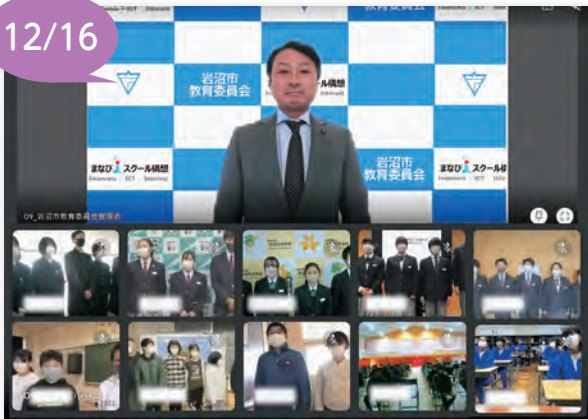
▲市役所と各校をオンラインでつなぎました

市役所、市内小・中学校、ゲスト参加の川崎町立富岡中学校をオンラインでつなぎ、「教育・いじめ防止子どもフォーラム」を開催しました。オンラインによるフォーラム開催は今年で3年目となります。 各校が、あいさつ運動、異学年交流活動、奉仕活動などの特色ある活動やいじめ防止に向けた取り組みを発表しました。子どもたちは、フォーラムを通して多様な考え方に触れ、自校の良さを実感したり、他校の取り組みに感心したりと、これからの学校生活改善に向けた意識を高めていました。