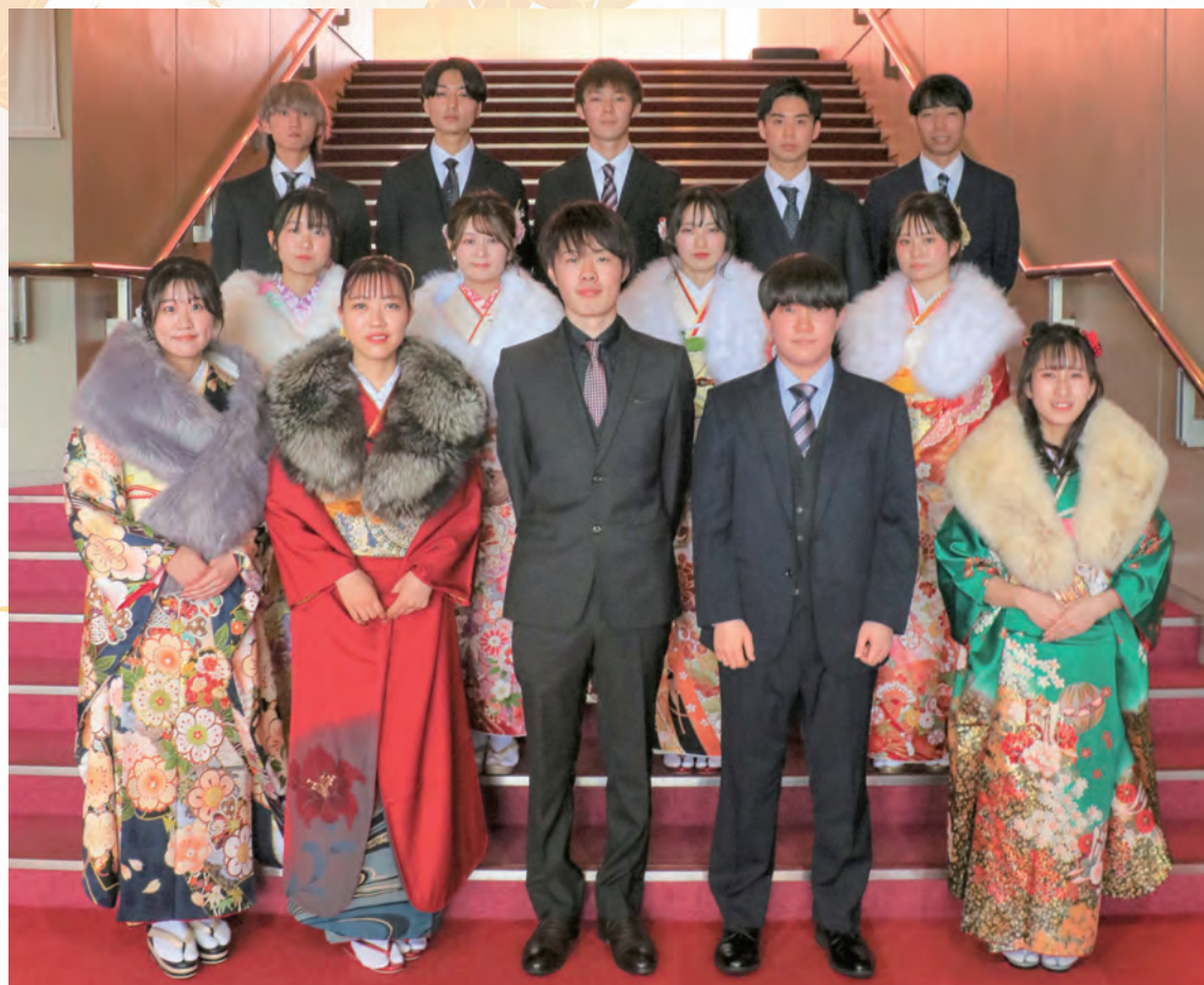
▲二十歳を祝う会実行委員の皆さん

二十歳を祝う会第2部の内容は実行委員14人によって企画・運営されています。代表して4人の皆さんに将来に向けての決意を聞きました。