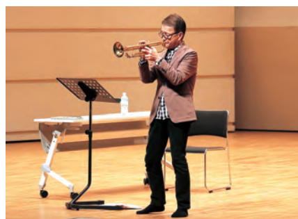
▲トランペットの力強い音色が会場に響き渡りました

生徒は「トランペットの音が力強く、心が温かくなるような吹き方で聴いてとても心地良かったです」と感想を話しました。