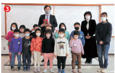
▲岩沼保育園の年長児が市役所を訪問しました