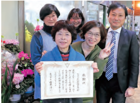
▲(有)阿部園芸店の皆さん