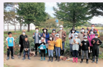
▲令和4年度参加の皆さん

小学生がいる家庭を対象に募集し、令和3年度は4家族、4年度は6家族の申し込みがあり、その年により種類は異なりますが、かぼちゃや枝豆、にんじん、ねぎ、とうもろこし、ブロッコリーなど、たくさんの野菜を育てました。大豊作の年もあれば、病気にかかり、うまく成長しないこともありました。しかし、野菜の作付けや収穫を通して、普段の食卓に並ぶお米や野菜の大切さを学べる機会になっています。