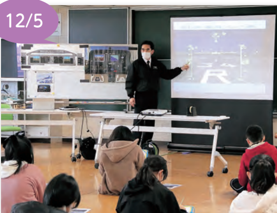
▲実際に操縦士が見ている映像を見て学びました

児童たちは「とても面白かった。飛行機についてもっと知りたいと思った」と話しました。