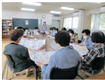
▲フレイル予防の出前講座

市では、フレイル予防に役立つ健康づくりのための各種イベントや教室、地域サロンなどでの出前講座を行っています。