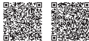
▲Google Play ▲App Store