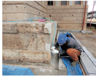
▲昨年の修復作業（基壇の復元）

内の修復が終了しましたので、内部の見学も可能です。※申し込みは不要です。 問／竹駒神社 (☎222101)