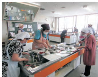
▲魚のヘルシーカツレツや、かぼちゃのそぼろ煮などを作りました

参加者からは、「暑い日が続く」と偏った食生活になりがちですが、バランスの良い食事を心がけ、毎日の食生活を楽しみたいです」などの感想をいただきました。次回は10月に開催を予定しています。