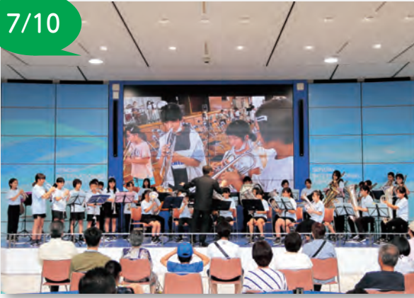
▲元気に演奏する児童

～地域交流イベント～ ザ・ミュージック 仙台空港で、「地域交流イベント ザ・ミュージック」が行われ、岩沼小学校金管バンドの皆さんが演奏を行いました。 演奏曲は、群青やピースサインなどJPOP計4曲で、リズムに乗って元気に演奏する児童の様子が見られました。 アンコールでは、銀河鉄道999が演奏され、金管バンドの音色と会場の手拍子が一体化し、大きな盛り上がりを見せていました。 演奏を聴いた方は「迫力のある演奏で元気をもらえた」と話し、会場には多くの笑顔があふれました。