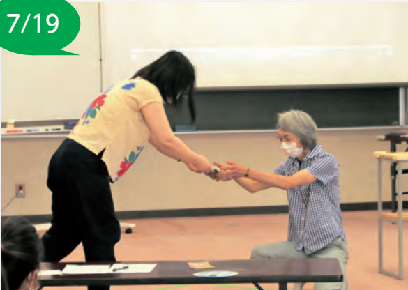
▲子どもへの接し方を実践する様子

～楽になりたい子育て講座～ 保健センターで、「してみせて、言ってみせて、させてみる」をテーマに令和4年度子育て講演会が行われました。キャプネット・みやぎ子育て講座トレーナー3人を講師に迎え、9組の親子が参加しました。 講座では、子どもを褒めたり叱る時は、子どもの行動を具体的に表現し、伝えたいことを簡潔に言うことが大切であるなど、実践をしながら学びました。 参加した方は、「子どもが成長していくなかで、大事なことを知れてよかった」と話しました。