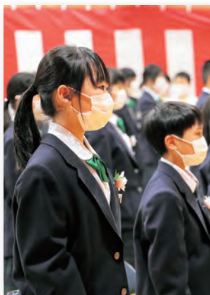
▲③入場時に整列しました