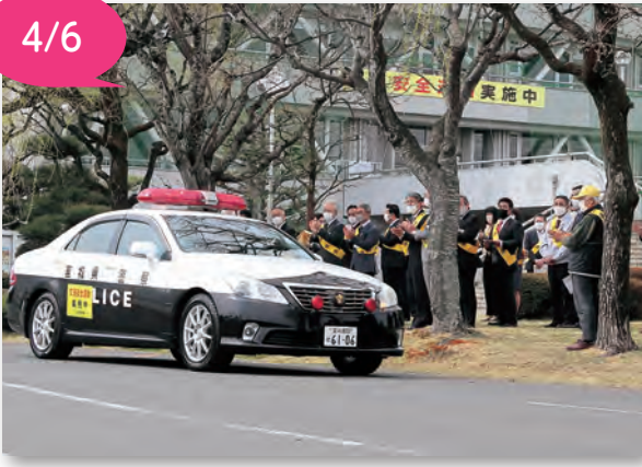
▲安心・安全を願ってパトカーを見送りました