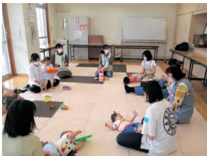
▲サロンで会話を楽しまます