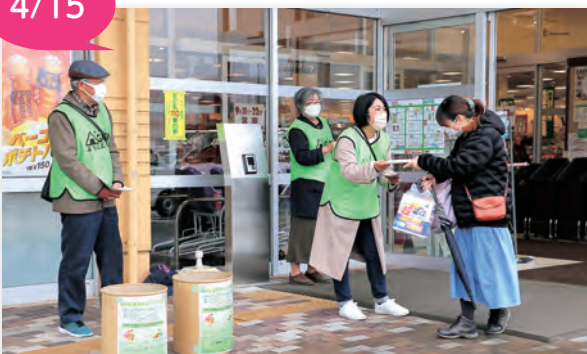
▲ヨークベニマル岩沼西店で広報活動が行われました