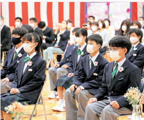
▲④きりっとした姿で話を聞く生徒