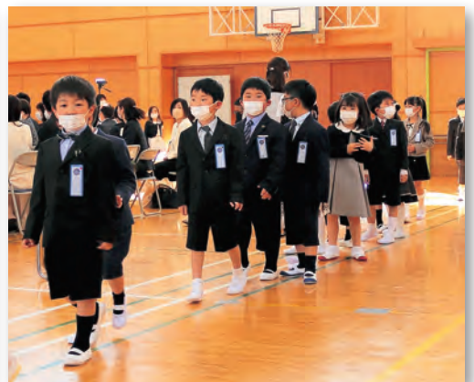
▲②一列に並んで移動する新入生