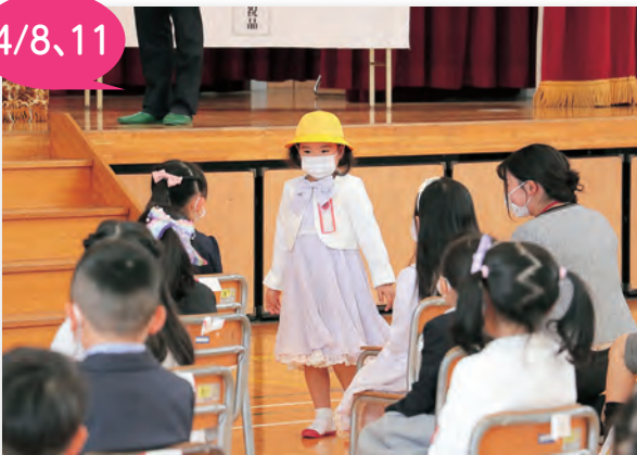
▲①代表で黄色い帽子を被りました