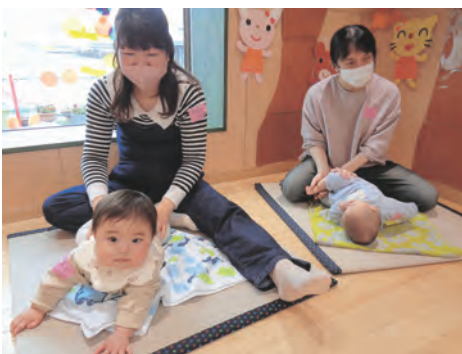
▲親子一緒に交流しましょう