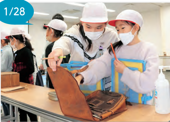
▲今と昔のランドセルの違いを実際に触れて学びました

児童は「洗濯板のギザギザが硬くて痛い」「ランドセルが今よりも小さい」「昔の電話はどうやって相手に掛けるの」と興味深く学んでいました。