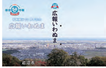
▲表紙はグリーンピア岩沼第一展望台から見た市内の風景

配布場所／さわやか市政推進課、いわぬま市民交流プラザ、玉浦コミュニティセンター、グリーンピア岩沼