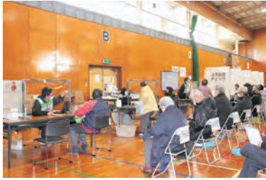
▲ワクチン接種会場