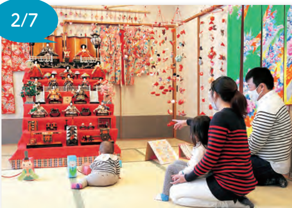
▲華やかな雰囲気を感じることができます

見に来た方は、「きれいだね」と話し、親子で一足早い春の訪れを楽しみました。展示は3月3日(木)まで行われています。