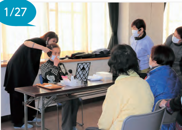
▲手本を見せながら解説していただきました

参加者は、「難しかったが、本格的に学ぶことができ嬉しかった」「説明がとても分かりやすくして良かったです」と話し、眉メイクを楽しんでいました。