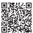
▲ごみの分け方と出し方