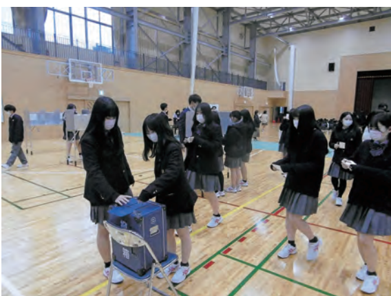
▲順番に投票していく生徒たち