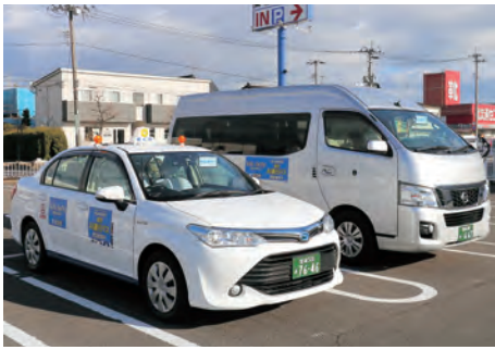
▲岩沼A1運行バスのステッカーを貼った2台が走ります