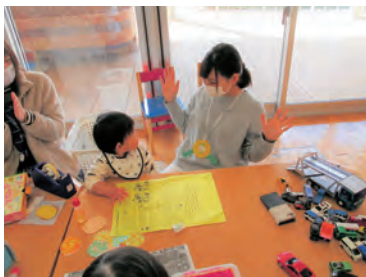
▲昨年のハッピー♡ママ工作