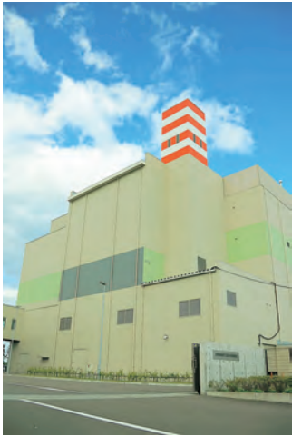
▲岩沼東部環境センター(ほぽか)

燃えるごみ(可燃ごみ)、資源物(プラスチック製容器包装、ペットボトル、びん、缶など)は、必ず決められた曜日に出してください。