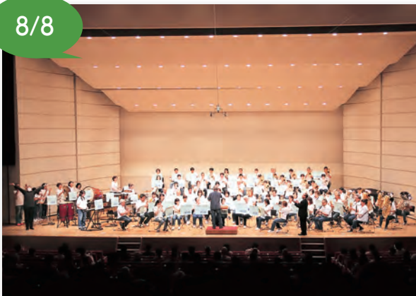
▲約80人の大合奏で奏でる大迫力の音楽