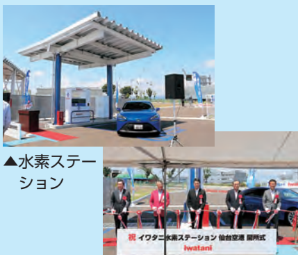
▲水素ステーション

市では、水素ステーションの開所に合わせ、FCVを公用車として1台導入しました。脱炭素社会の実現に向け、環境に優しいまちづくりに取り組みます。