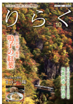
▲情報誌「りらく」10月号表紙