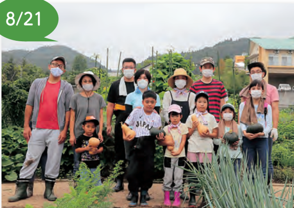
▲家族ごとにたくさん収穫できました