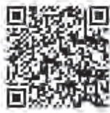
▲市内の災害時協力井戸はこちら

災害時協力井戸の設置箇所などについては、市ホームページに掲載していますので、ご確認ください。