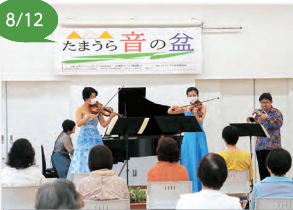
▲ハナミズキ室内合奏団による演奏