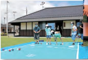
▲ボッチャを体験する子どもたち