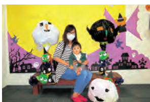
▲昨年の映えアート