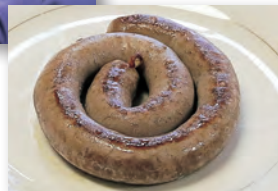
▲切り分ける前のブルボス