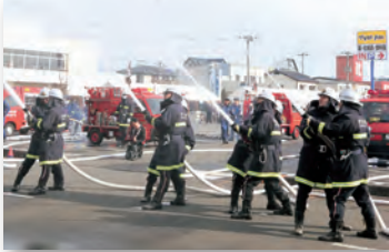
▲冬の寒さを感じさせない力強い足取りで街頭を行進