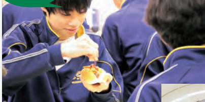
▲コッペパンに挟んでホットドッグにしました