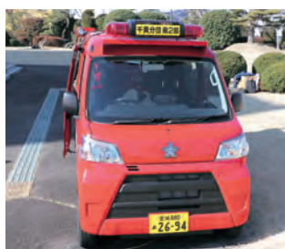
▲千貫分団第2部に配備された車両