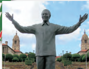
▲ネルソン・マンデラ像