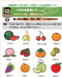
▶啓発用ポスターの「いわぬま食育レター」