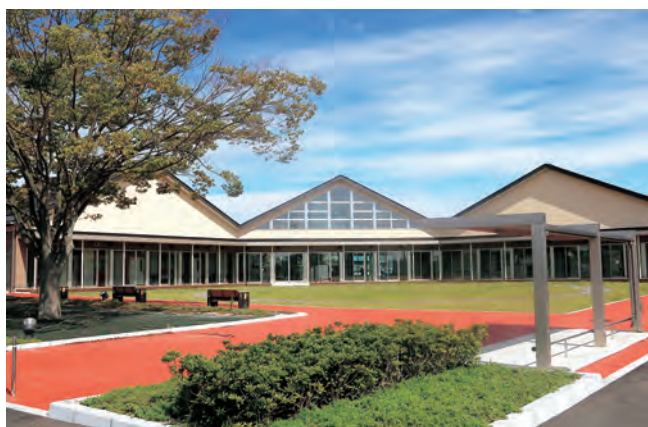
▲玉浦コミュニティセンター