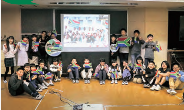
▲オリンピックでの両国の応援を誓いました