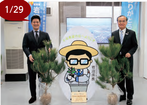
▲クロマツを囲む村越市川市長（左）と菊地市長