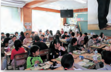
▲米は給食委員会が代表して受け取り、給食で振舞われました