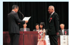
▲孫と一緒に歯の表彰