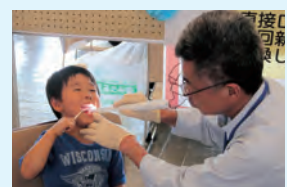
▲口腔内カメラでお口の中をのぞいてみました