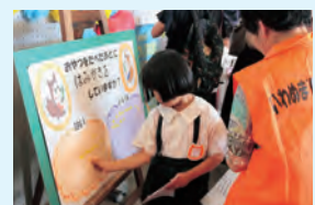
▲健康意識調査をしました