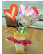
▲簡単な製作も行います