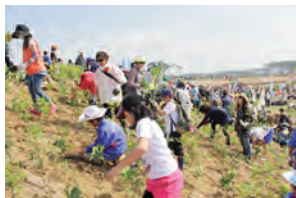
(写真：植樹祭の様子)