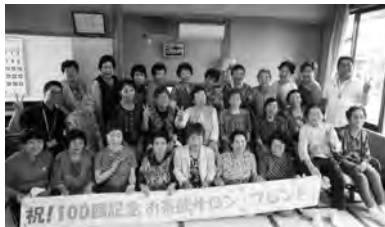
お茶飲サロン「フレンド」