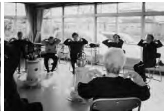
ふれあいサロン「ハッピー」