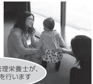
助産師・保健師・管理栄養士が、相談支援・情報提供を行います