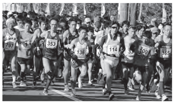
▲一斉に走り出すランナー（10kmの部）