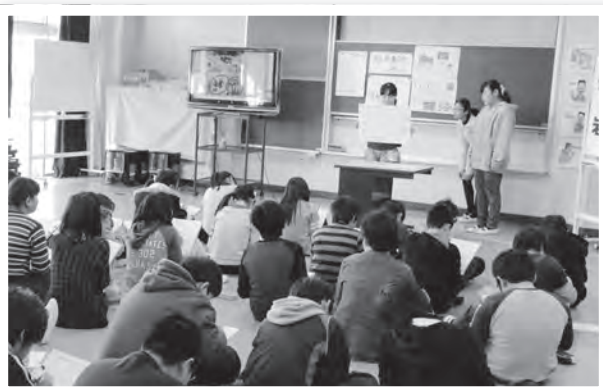
▲プレゼンテーション方式で発表をする児童たち