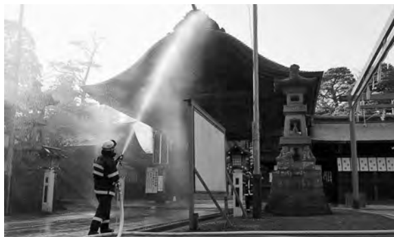
▶向唐門に向かって放水する消防署職員