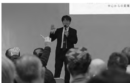
▲参加者の皆さんからは多数の質問が出され、減災・防災への意識の高さがうかがえました

前日の降雪により足元の悪い中、来場された120人の皆さんは、減災・防災対策に対して真剣に向き合いつながり講演に耳を傾けていました。