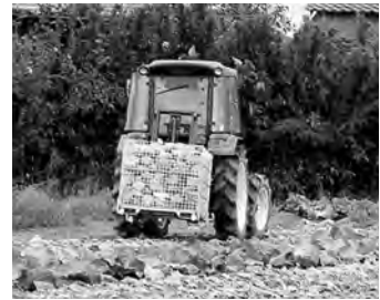
▲専用機械によるキャベツの収穫作業

省力化による余剰労力や地域内雇用により、育苗ハウスを活用し「ほうれんそう」や「つるむらさき」などの栽培に取り組むなど、経営の複合化を図る取り組みで地域を先導した功績が高く評価されました。