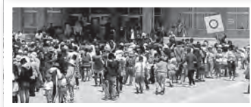
▲親子競技や まるぼつ ○×クイズで運動会は和気あいあいとした雰囲気でした