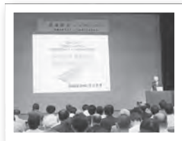
▲井口市長による基調講演