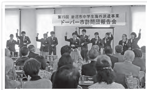
▲息の合ったダンスを披露する団員たち。団員たちの絆が感じられました