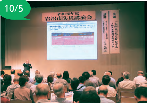
▲台風時の避難で役立つ話をさせていただきました