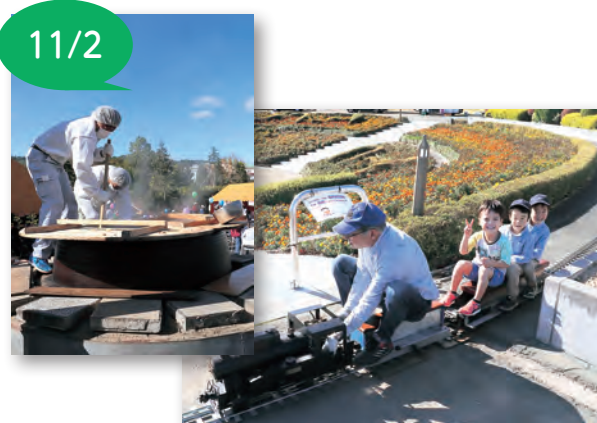
▲千人鍋を作っている様子とミニSL

教室の最後には、使用時の注意点を「た・ま・う・ら」を合言葉として全員で復唱しました。