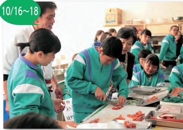
▲サケをさばく生徒たち