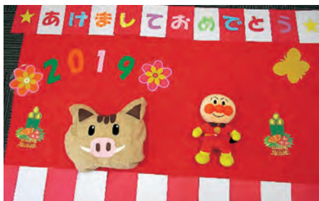
▲2019年のおひるねアート