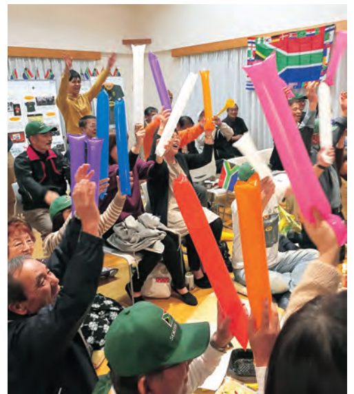
▲決勝戦でのスプリングボックスを応援

南アフリカ共和国には、東日本大震災時にご支援いただきました。その縁で岩沼市は、東京2020オリンピック・パラリンピックにおける同国の復興「ありがとう」ホストタウンに選ばれており、大会直前の9月には震災で被災し玉浦西地区に集団移転した住民の代表と市内中学生の代表がスプリングボックスに千羽鶴や寄せ書きなどをプレゼントしています。