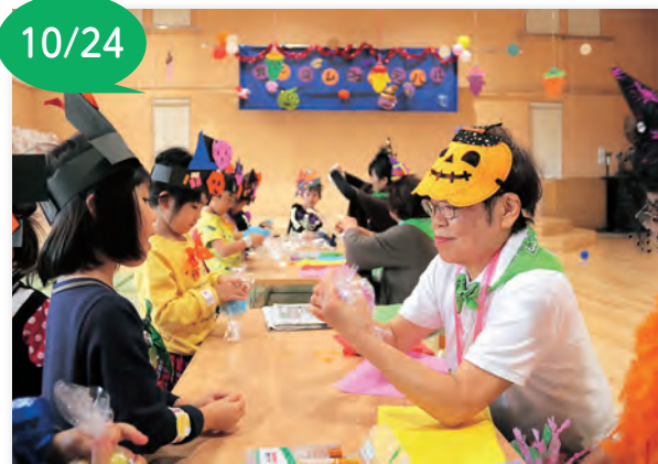
▲地域の方との交流を深めました

生徒は「とても美味しかった。楽しかった」「今まで作ったことがなかったし、ふるさとの味に直接触れる機会となりました。」