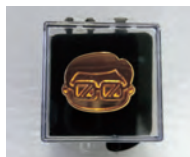
▲ケース付きバッジ

皆さんの期待の大きい令和元年記念イベントの岩沼係長限定グッズが決定しました。応募者の中から抽選で以下の3点がセットになって500人に当たります。ぜひご応募ください。※当選発表は発送をもって代えさせていただきます。