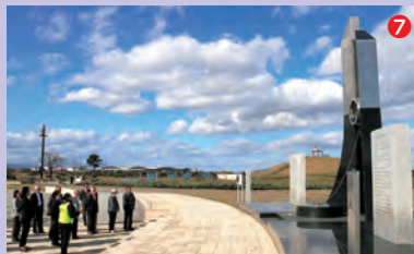
①岩沼市民訪問団の皆さん、②農家レストラン蔵で細野地区の方と交流、③芭蕉・清風歴史資料館を見学、④交流会では花笠おどりを披露していただきました、⑤尾花沢市民訪問団の皆さん、⑥岩沼リゾートで歓迎会、⑦語り部ガイドによる案内で千年希望の丘を見学、⑧岩沼音頭を両市の皆さんで踊りました