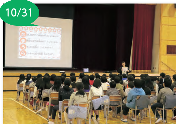
▲真剣にスマホ・携帯電話の使い方を学びました

東子育て支援センターにはお化け屋敷もあり、子どもたちは楽しい一日を過ごしていました。