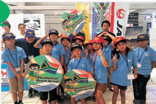
▲おにぎりを配布した岩沼航空少年団の皆さん