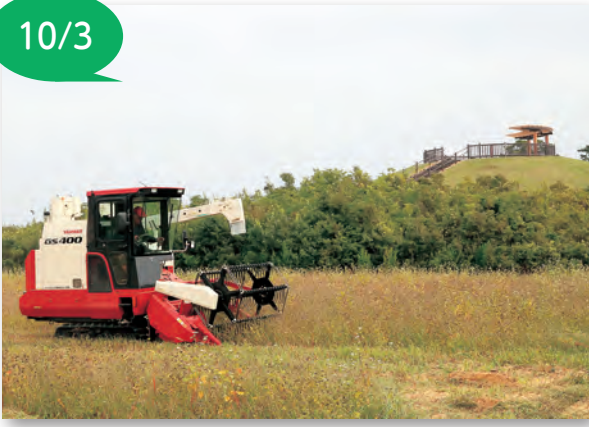
▲コンバインでソバを収穫する様子