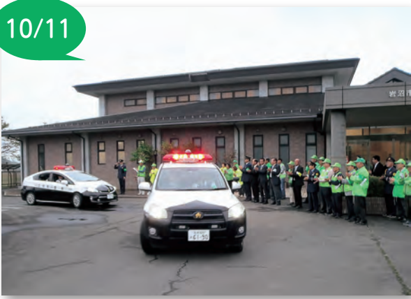
▲出動するパトカーを見送る関係者の皆さん