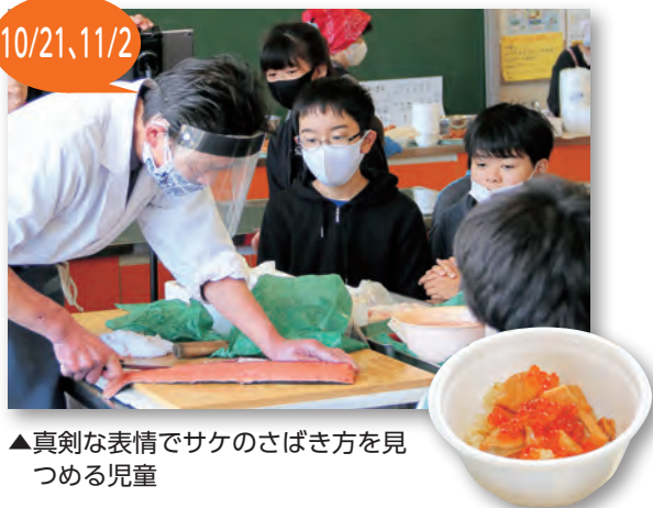
▲真剣な表情でサケのさばき方を見つめる児童

玉浦小学校で、ふるさに愛着を持つてもらおうと、6年生67人を対象に郷土料理の学習が行われました。