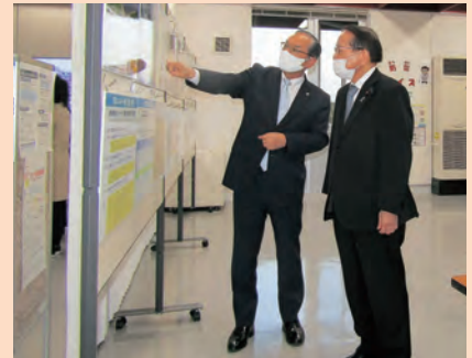
▲説明を受ける平沢復興大臣（右）

平沢復興大臣は「さまざまな地域を見てきたが、それぞれに合った支援が必要であると感じた」と話されました。