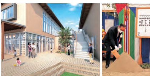
▲木造2階建てで、調理室や多目的室などがあります

防災コミュニティ活動や市民活動などを通した生きがいづくりの拠点としての役割も期待されています。