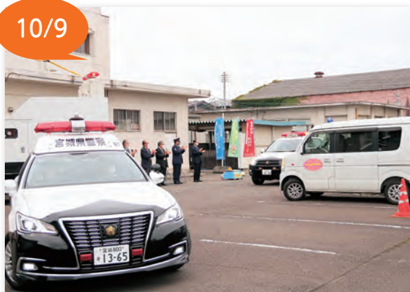
▲各地へ出動する皆さん

岩沼警察署で、「全国地域安全運動の出動式」が行われ、岩沼警察署管内の防犯協会や防犯ボランティアの皆さんが参加しました。この運動は毎年10月11日～20日の10日間にわたって実施されています。