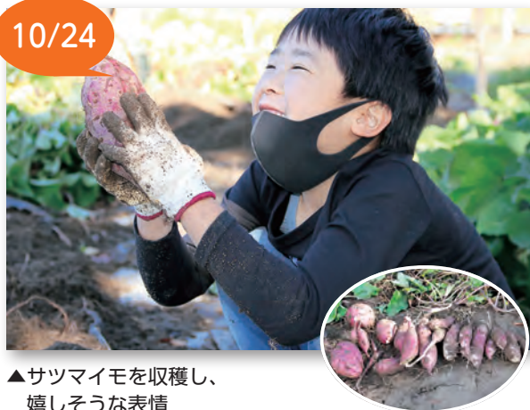
▲サツマイモを収穫し、嬉しそうな表情

ハナトピア岩沼で、食育事業の一環として「サツマイモ収穫&焼きいも体験」が行われ、約50人の親子が参加しました。