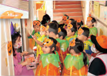
▶元気な声で「トリック・オア・トリート」

相の原保育所で「ハロウィーンパーティー」が行われ、保育所の子ども61人が参加しました。 子どもたちは、それぞれ魔法使いやジャックオーランタンなどのハロウィーンにちなんだ衣装をして、「トリック・オア・トリート」と大きな声で唱え、魔女に扮した先生たちから、お菓子をもらいました。 自分たちの力でお菓子を手繰りよせるゲームもあり、子どもたちは年に一度のハロウィーンを満喫していました。