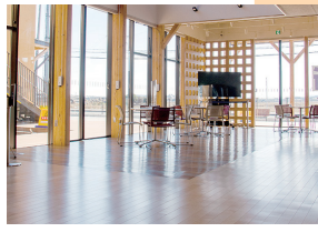
freeWi-fiを設置しています。 ※時間制限あり