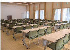
3室つなげた状態(机・椅子設置例)