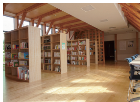
約4,000冊の本を備えています。