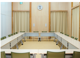
各室利用時(机・椅子設置例)