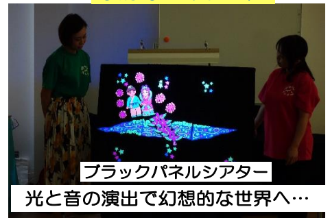
ブラックパネルシアター 光と音の演出で幻想的な世界へ…