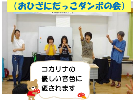
ココリナの 優しい音色に 癒されます