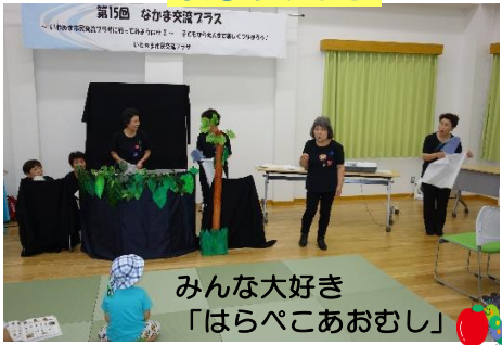
みんな大好き 「はらべこあおむし」