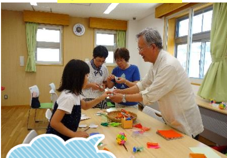
初めてだけど 楽しかった