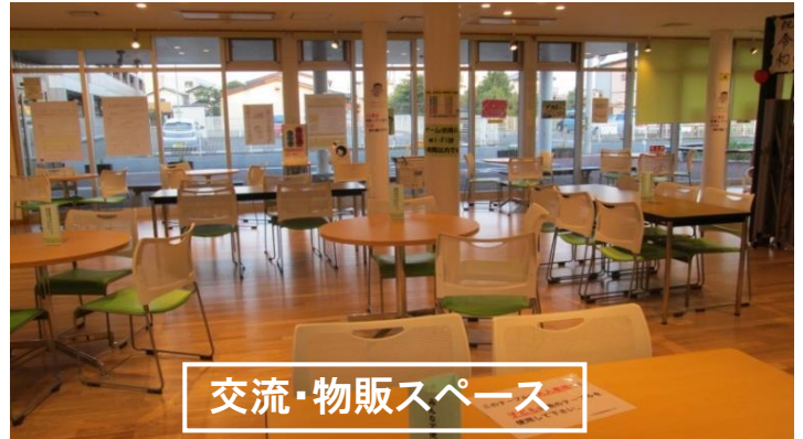
交流・物販スペース