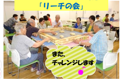
また、 チャレンジします