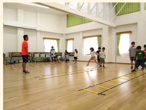
七転八起ランニングクラブとの運動の体験