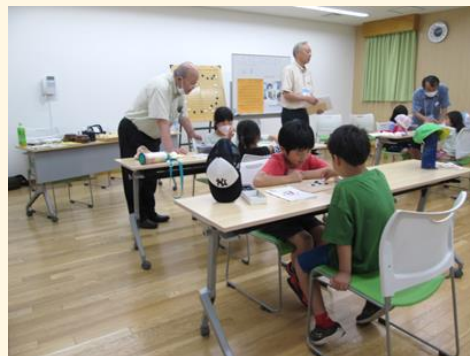
日本棋院・仙南中央支部との囲碁の体験

それぞれの体験を夢中で楽しんだ児童たちは「生まれて初めて囲碁を知った。おうちでもやってみよう」、「いろいろな運動ができてとても楽しかった」など思い思いの感想を嬉しそうに話していました。登録団体の方は、「この交流会をきっかけに、新しいつながりを作っていきたいです」と話していました。