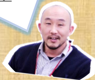
サポートセンター相談員

活動経費の中で見逃してしまいがちなのが、ちょっとした「持ち出し」です。自宅のプリンターで印刷をした用紙やインク、車で送迎した際のガソリン代など出費は小さいので、「持ち出し(個人の負担)でいい」と思いがちですが、ちりも積もれば山となります。特定の個人だけがいつも持ち出すことのないよう、団体の中で精算のルールを決めることをお勧めします。例えば、「印刷 10 枚毎〇〇円」とか、「車を出した人には 1km あたり〇〇円」などと決めて、定期的に精算の機会を設けます。個人の「持ち出し」を精算することで活動経費が思っていたよりも多かったことに気付くかもしれませんよ。