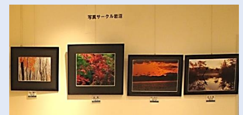
2階展示コーナーの展示風景（例）