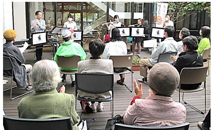
コンサートの様子

コンサート終了後は集会室に移動してお茶などを飲みながら、日頃の悩みや、困りごとなどを相談員の方をまじえてお話ししていました。