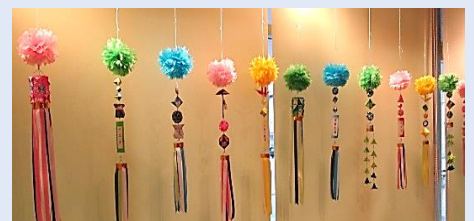
1階展示コーナーの展示風景（例）