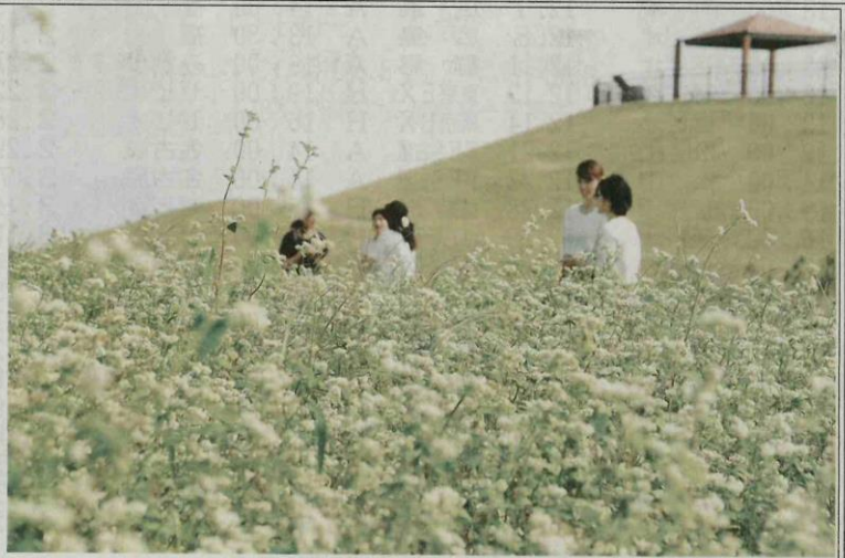
見頃を迎えたソバの花