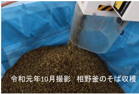
令和元年10月撮影 相野釜のそば収穫

2019年度は機械を使った受粉作業も行い、順調に生育。およそ300kgのそばが収穫できました。