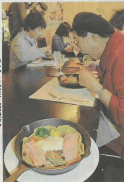
ガレットを試食する招待客ら

岩沼市の千年希望の丘相野釜公園近くの畑で収穫したソバを使ったフランス料理の試食会が11月29日、同市土ヶ崎の飲食店「ピストロ・セルクル」であった。12月4日から市内4店舗で提供