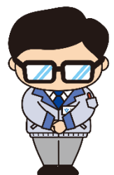
岩沼市マスコットキャラクター 岩沼係長

2020年度以降も、企業版ふるさと納税の対象事業に認定されることを目指し、「千年希望の丘」周辺の活性化に力を入れて参りますので、ご理解・ご協力のほど、よろしくお願い申し上げます。