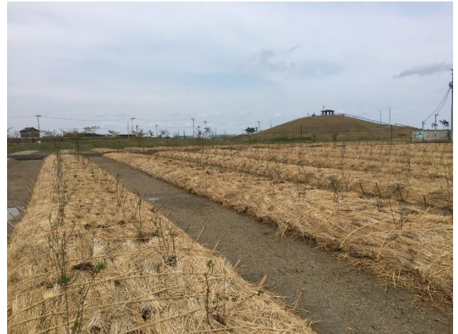
千年希望の丘と植栽したはまなす