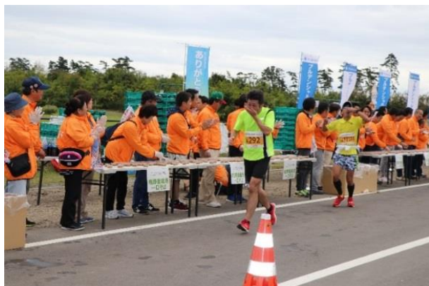
↑ 東北・みやぎ復興マラソンにて一口そばを提供(2018年10月)