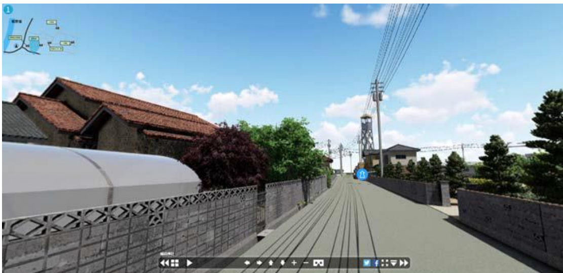
↑ 景観再現VR(画像は修正中のもの)