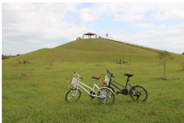
↑ レンタサイクルの開始(2018年10月)

上記の取組にご寄附を活用させていただきました。 ご賛同いただいた企業の皆様からのご支援に深く感謝申し上げます。