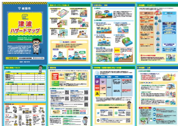
津波ハザードマップ

また、配布にあわせて、添付のとおり津波ハザードマップ説明会を開催します。ぜひ、取材くださいますようお願いいたします。