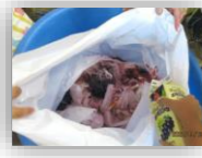
ジュースも入れて～！