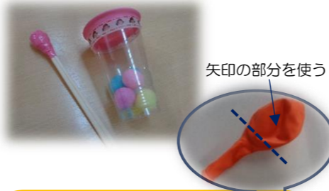
矢印の部分を使う