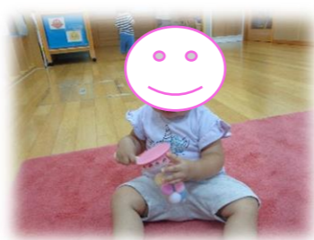
1歳位から太鼓としても楽しく遊べます♪