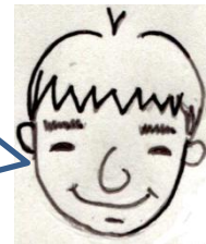
table host Yamaguchi.

生きていく中で、出会いと別れがあるように、たくさんの切れ目は存在する。一貫した支援システムも必要だけど、『人類皆兄弟』たくさんの隣人(近隣住民、友人、知り合い等)に関心を持ち、みんなで支えあえる地域づくりも大事だよ。