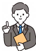
弁護士 司法書士 社会福祉士