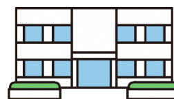
社会福祉法人 NPOなど