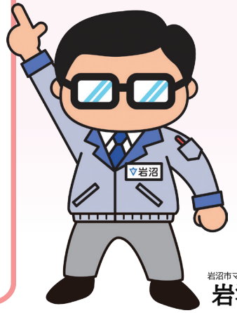
岩沼市マスコットキャラクター 岩沼係長