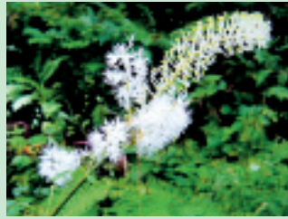
サラシナショウマ (花期 9~10月)