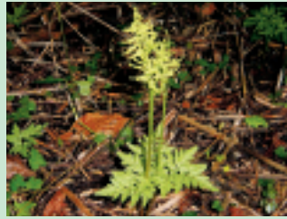
フノハナワラビ (花期 9~10月)