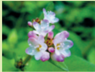
ミソソバ (花期 8~10月)