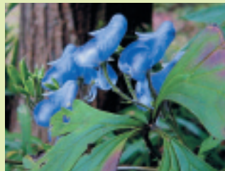
ミヤマトリカブト (花期 9~10月)