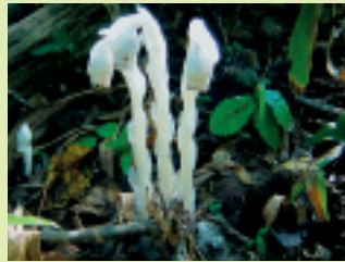
アキノギンリョウソウ (花期 8~9月)