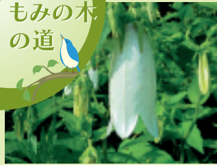
ホタルブクロ (花期 6~7月)