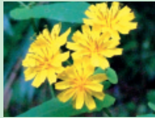
ヤクシソウ (花期 9~10月)