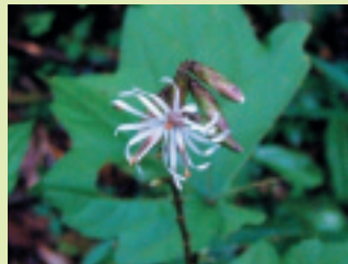
オクモミジハグマ (花期 9~10月)