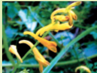
ナガミノツルクケマン (花期 9~10月)