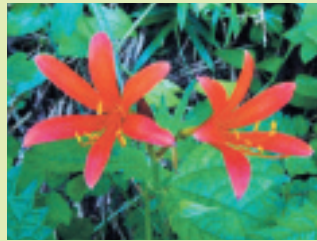
カツネノカミソリ (花期 8~9月)