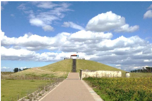
写真3 避難の丘（2号丘）