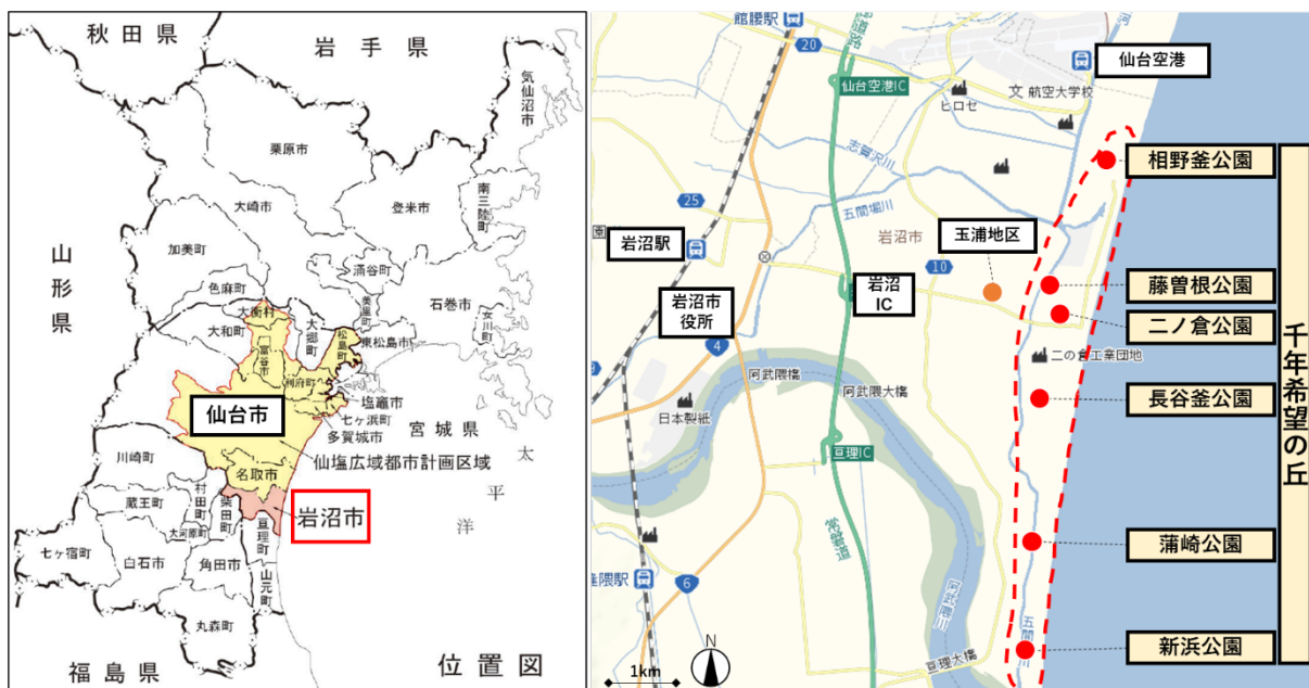
図1 施設広域位置図

千年希望の丘は、仙台市に南に位置する岩沼市の太平洋沿岸にある6公園で構成されます。最北に位置する「相野釜公園」は、JR岩沼駅から直線距離で約6.5km、仙台空港から直線距離で約1.0kmの場所に位置し、仙台市からのアクセスも良好です。