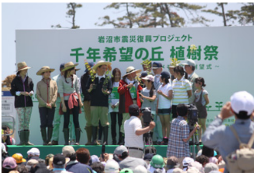
写真5 千年希望の丘 植樹祭