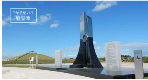
写真1 避難の丘と慰霊碑