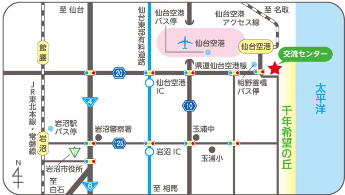
図 2 アクセス図

「相野釜公園」には、東日本大震災の慰霊碑や津波被害を受けた住居跡の震災遺構等があり、また「避難の丘」に登って、実際の津波高さを体感することもできます。