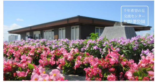
写真2 千年希望の丘交流センター