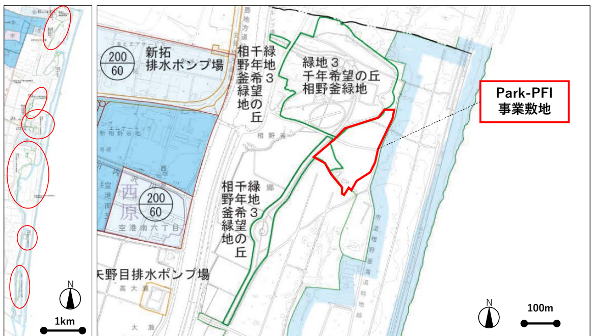
図 3 維持管理運営の敷地(左)、Park-PFI 事業敷地(右)