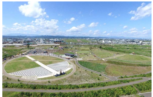
写真4 相野釜公園遠景