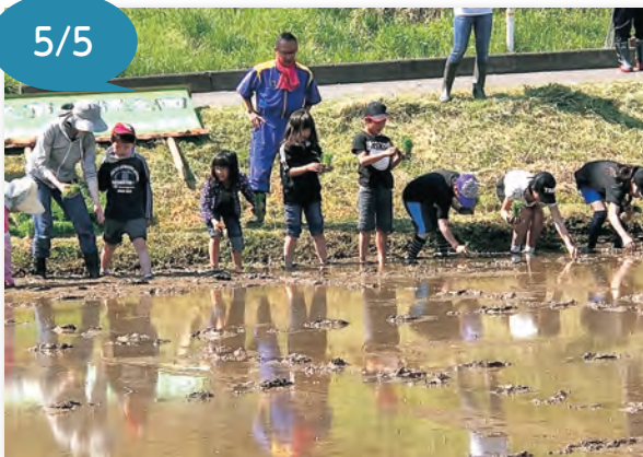
▲おいしいお米が穫れるよう、丁寧に苗を植えました

志賀地区集会所近くの水田で、「親子田植え体験」が行われ、小学生の親子約60人が参加しました。 この田植え体験は昨年度から始まったもので、農事組合法人志賀、志賀の郷保全会、志賀子供会の3団体が企画しました。 参加者らは、田んぼの土に足をとられながらも手植えでひとめぼれの苗を植えていきました。 10月ごろに稲刈りを予定しており、参加者には収穫された新米が配られるとのことでした。