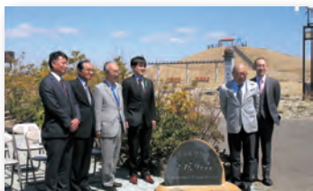
▲皇居の森と書かれた記念碑が設置されました

同日には、県の準絶滅危惧種に指定されているハマナスの苗木約800本を植樹しました。