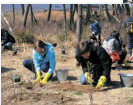
▲ハマナスの苗木を植樹しました