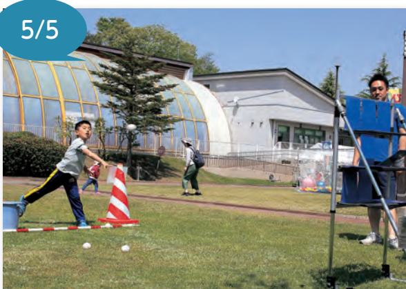
▲的を狙ってボールを投げる子どもたち

グリーンピア岩沼で、「こどもの日イベント」を開催しました。 今年のゴールデンウィークは例年よりも長い期間となりましたが、この日は好天に恵まれ、たくさん家族でにぎわいました。 体験コーナーの一つであるピッチングターゲットには、しばらく列が続くほどの人気で、子どもたちは、ビンゴを目指し、的を狙ってボールを投げていました。 また、グラウンドゴルフや工作遊びなど体験することにスタンプがもたえて、景品を笑顔で受け取る子どもたちの様子が見られました。