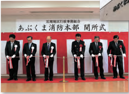
▲テープカットで開所を祝う関係者