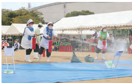
▲標的を目掛けて放水しました