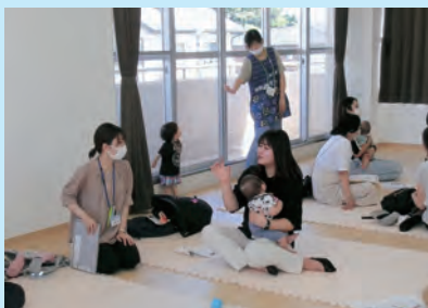
▲さまざまな質問に答えました

参加者は「個別に質問できる時間があった良かった」、「分からなかったことを知ることができて良かった」と話しました。