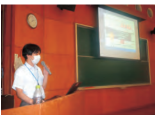
▲県の担当者が説明しました