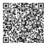
▲出生連絡票の提出

電子申請を利用した場合は、母子健康手帳別冊にある出生連絡票(はがき)の提出は不要です。