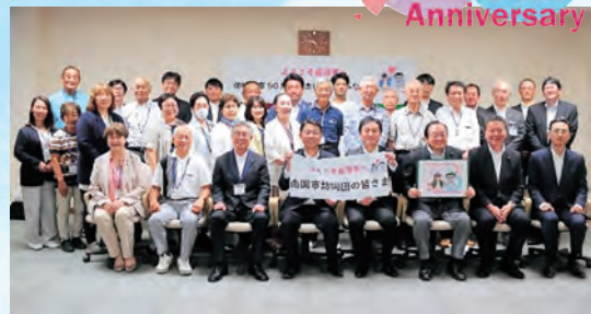
▲南国市民訪問団の皆さん

8月20日～22日、南国市の小・中学生23人が岩沼市を訪れ、玉浦小・中学校の児童・生徒と交流しました。