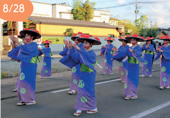
▲5年ぶりに参加した吉村流若草会の皆さん