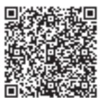
▲産後ケア事業の利用申請

産後ケア事業とは、産後のママが安心して子育てできるように、助産師など専門スタッフの育児支援を受けられるサービスです。宿泊型・通所型・訪問型の3種類があり、産後1年未満に1人7回利用できます(通算5回目までは利用料無料)。詳しくは市ホームページをご覧ください。