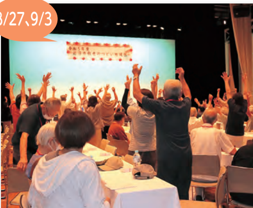
▲軽運動を楽しみました