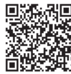
▲小児・乳幼児の予約はこちら