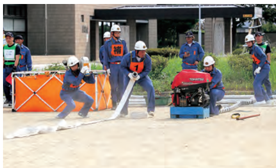
▲チームで連携してホースを結合

競技の結果、玉浦分団第4部と原婦人防火クラブの優勝となり、大会を通じて参加者全員の技能向上と士気高揚につながりました。