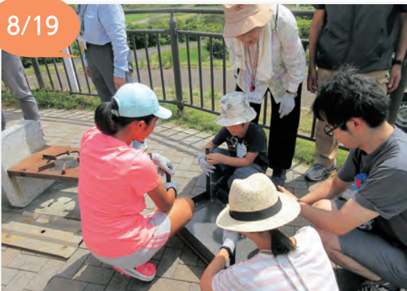
▲かまどベンチを組み立てる様子