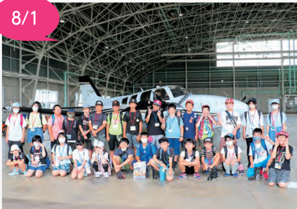
▲航空大学校での集合写真

交流を深めよう 〔小学生交流〕 4年ぶりに友好都市の山形県尾花沢市との「小学生交流」が行われ、尾花沢市と岩沼市の小学生28人が参加しました。 市役所での歓迎式の後、航空大学校、(株)岩沼精工、いわぬまみつじ村を訪れました。 航空大学校ではフライトシミュレーター体験、格納庫の見学をし、間近で飛行機を見ることができました。(株)岩沼精工では工場内を見学した後、自分だけのオリジナルのこまを作り、どのこまが長い時間回るかを比べました。 貴重な体験を通して、両市の小学生の交流が深まりました。