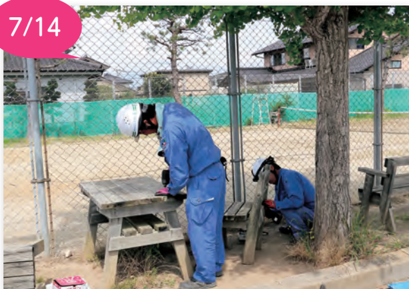
▲ベンチの補修作業（北中）