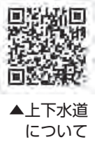
▲上下水道について