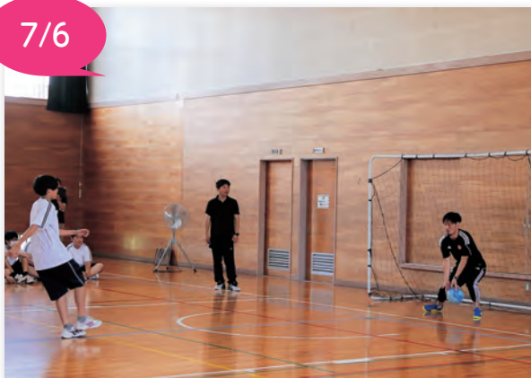
▲生徒とのPK対決で交流しました