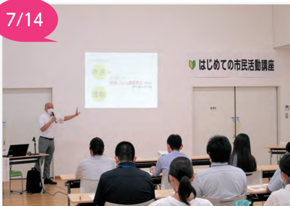
▲わかりやすく説明いただきました