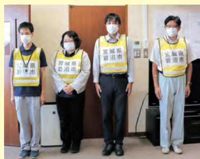
▲7月24日に出発式が行われました