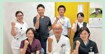
▲認知症初期集中支援チーム

医療や介護の専門職が、家族の相談などにより認知症が疑われる人や認知症の人、そのご家族を訪問し、必要な医療や介護の導入・調整や家族支援などの初期の支援を包括的・集中的に行い、自立生活のサポートを行うチームです。