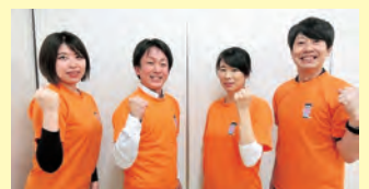
▲認知症地域支援推進員