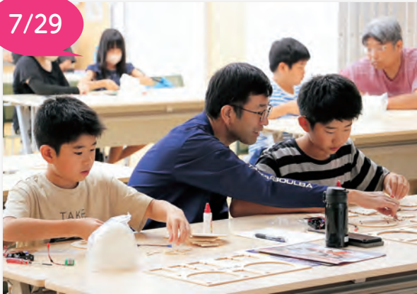
▲親子で一緒にランプを作りました

手作りランプで省エネ学ぶ 〔親子で学ぶ環境教室〕 西コミュニティセンターで、パナソニック(株)エレクトロニクスワークス社の方を講師に招き、「親子で学ぶ環境教室」が開催され、11組24名の親子が参加しました。 教室は、講義と工作を体験する内容で、電気の創り方（創）、創られた電気をためる仕組み（蓄）、電気を賢く使うこと（省）を学び、太陽光パネル、蓄電池、LEDが一体になったランプを作りました。 参加した保護者は「子どもと取り組むことができて有意義だった」、児童は「創・蓄・省について学び、工作も楽しめた。作ったランプを部屋に飾りたい」と話しました。