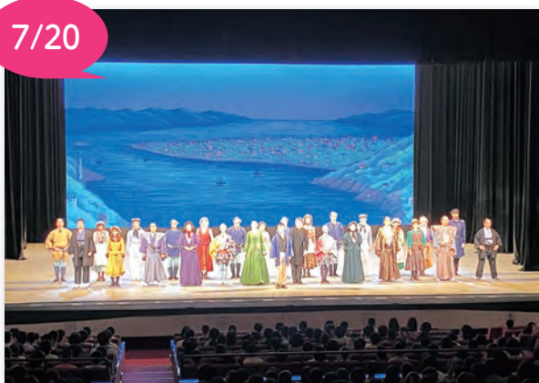
▲出演者によるカーテンコール