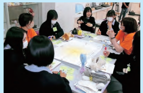
▲名取高等学校グループワークの様子