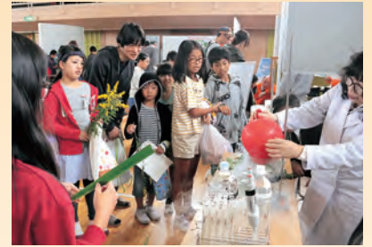
▲昨年度の実験ブースの様子