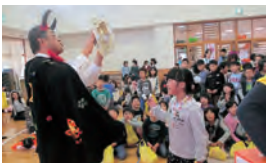
▼昨年はたくさんの子どもたちが遊びにきてくれました