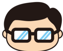
岩沼市マスコットキャラクター 岩沼係長